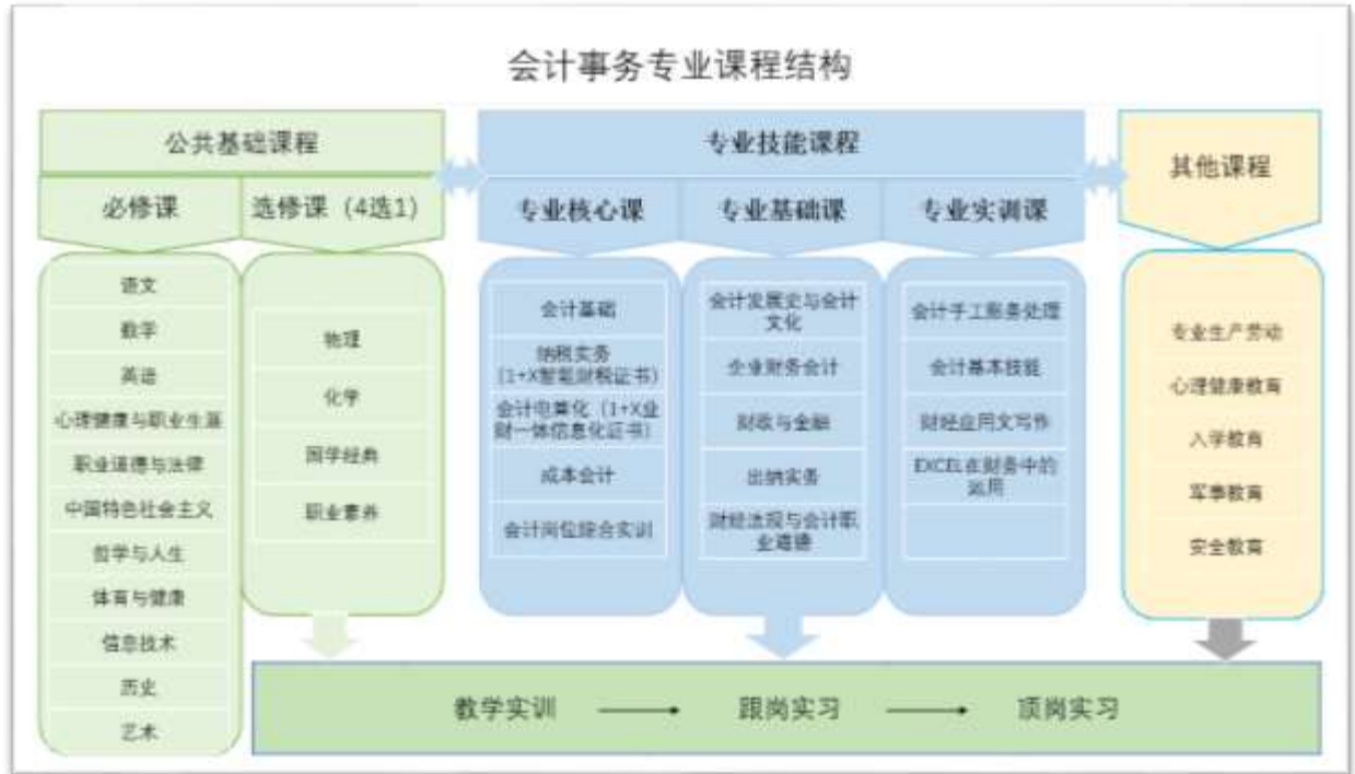
图 2 课程结构图