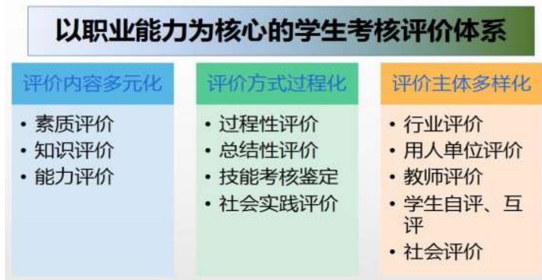
图 4 课程结构图

教学实施后，评定学生的学习成绩，考核学生掌握知识、技能的程度和能力水平以及达到教学目标的程度。通过对毕业生的跟踪调查、就业单位意见反馈和社会评价，对专业标准的科学性、合理性、适应性和毕业生的质量以及教学组织的满意度进行考察，为修订新的专业标准和教学实施方案提供依据。