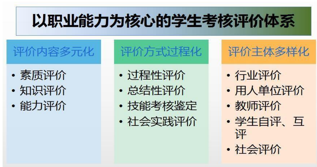
图 4 课程结构图

教学实施后，评定学生的学习成绩，考核学生掌握知识、技能的程度和能力水平以及达到教学目标的程度。通过对毕业生的跟踪调查、就业单位意见反馈和社会评价，对专业标准的科学性、合理性、适应性和毕业生的质量以及教学组织的满意度进行考察，为修订新的专业标准和教学实施方案提供依据。